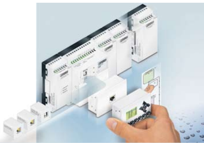
nanoLine - enkel controller fra PHOENIX CONTACT

Nu kan enkle styringsopgaver realiseres hurtigt og til den rigtige pris. Den nye nanoLine controller fra PHOENIX CONTACT består af en modulær basisenhed, som leveres i fem varianter med forskellige forsyningsspændinger samt forskelligt antal ind- og udgange afhængigt af antallet af moduler.