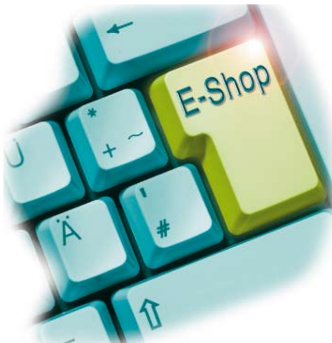
E-shop - enkelt og fleksibelt