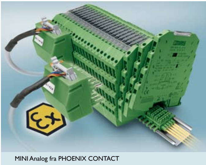
MINI Analog fra PHOENIX CONTACT